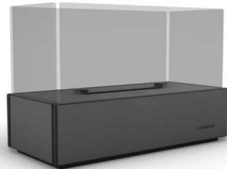
TABLE LUX H 27 . B 40 . T 18 cm Design: conmoto