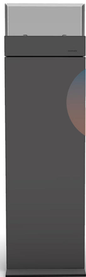
COLUMN LUX H 136 . B 40 . T 40 cm Design: conmoto