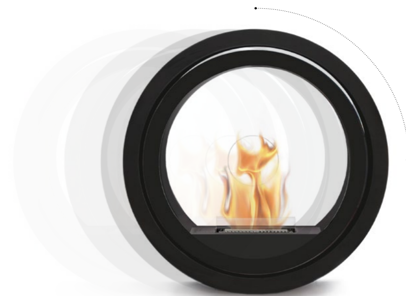
ROLL FIRE Rollbarer Kaminofen H 65 . B 65 . T 22 cm Design: Dieter Sieger

Der runde, rollbare Kamin ROLL FIRE lässt sich bequem durch Haus und Wohnung rollen, da der auf Kugellagern ruhende Tank stets ausbalanciert ist. Die Glasscheiben ermöglichen kompletten Durchblick und betonen die Leichtigkeit des Designs.